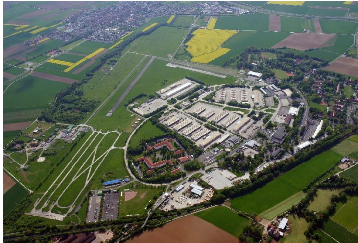
Conn Barracks, Schweinfurt