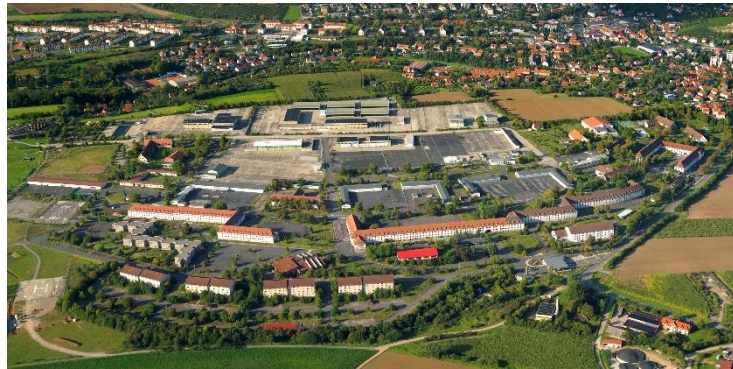
Innopark, Große Kreisstadt Kitzingen