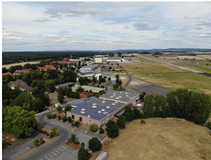
ConneKT, Große Kreisstadt Kitzingen