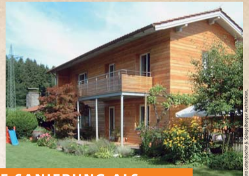
Foto: Kerschbacher & Scherzinger/Architektur, Innenarchitektur, Trautwein

EINE SANIERUNG ALS ALTERNATIVE ZUM NEUBAU