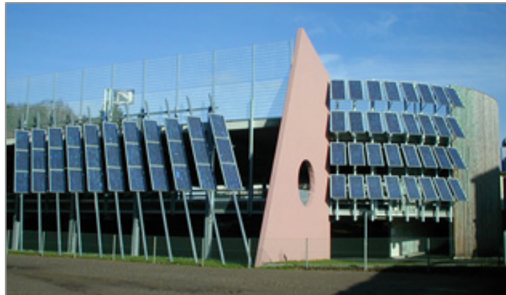
Ansicht von Süden mit Photovoltaikanlage