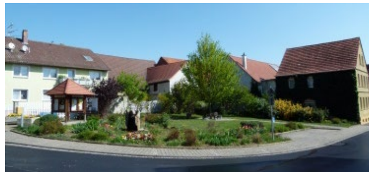
Neugestaltung der Grünfläche mit Brunnen