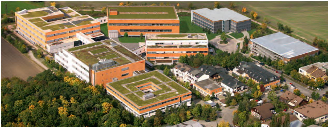
Foto: Hauptwerk der Schreiner Group in Oberschleißheim